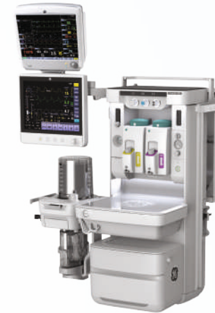
Система, монтируемая на стену (Carestation 650c)