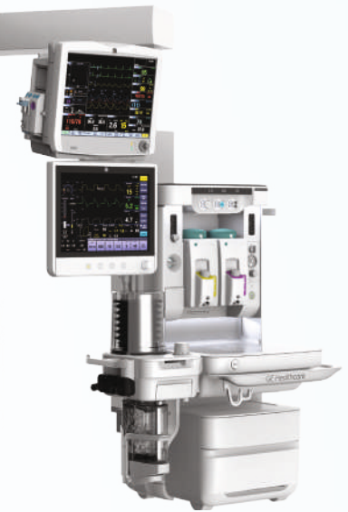
Подвесная система (Carestation 650c)